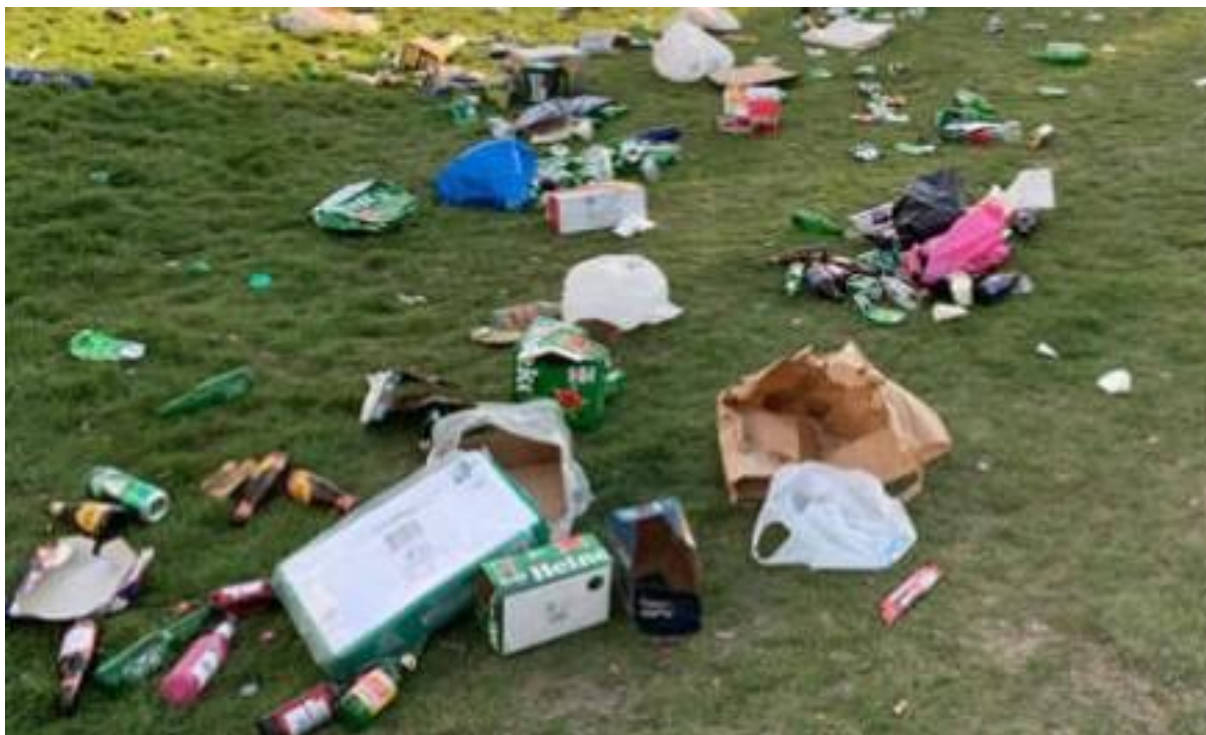
L'image de la nature est le reflet de la nature des Hommes.

Les frais d'examen par le jury final ne sont pas remboursables. Ils sont calculés sur la base de douze fois le montant de la licence Carte Montagne® individuelle de la saison en cours (Prix d'une licence individuelle délivrée par la fédération à ses "clubs affiliés"). Paiement par carte ou virement bancaire (chèques non acceptés).